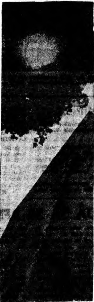
Razele soarelui de iunie și-au tăiat fereastră printre ramuri pentru a ajunge la fațadele noilor blocuri construite în Vulcan.

Americanul Pat Paulsen nu are poate cine știe ce talent la pictură, dar în schimb folosește ca pensulă niște obiecte cu totul ieșite din comun. La o demonstrație făcută recent în localitatea Glendale, statul California, el a așternut o pinză neagră pe jos, a pus alături niște grămezi de vopsele și... și-a vîrît barba în ele începînd să traseze pe pinză dire largi. Brusc, pictorul și-a băgat și o ureche într-una din grămezi, apoi nasul, apoi obrazul. Scena cea mare de-abia acum vine însă. Vîrîndu-și piciorul într-un lanț, prins de un scripete, care era manevrat de un amic, Paulsen a ordonat să fie răsturnat cu capul în jos și, repezindu-se în chip de berbec în grămezile cu vopsea, a început imediat după aceea să se zvîrcolească în dreapta și în stînga pe pinza răbdătoare. „Capodoperă” era gata..