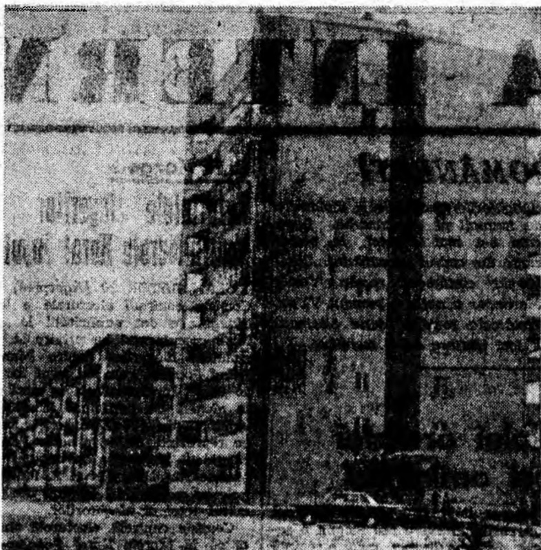
PETRIȚA. Blocuri moderne își înalță cu eleganță siluetele în noul cartier „8 Martie”.

Munca plină de entuziasm pe care o desfășoară poporul român pentru a realiza Directivele Partidului, încrederea nețărmurită a poporului în politica partidului ne obligă pe noi, conducători ai diferitelor ramuri economice, să ne desfășurăm activitatea în așa fel ca să fim la înălțimea marii etape istorice pe care o parcurge patria noastră.