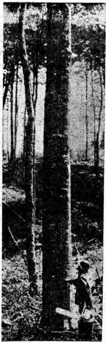
Înainte de marea căldorie spre combinatele de industrializare.