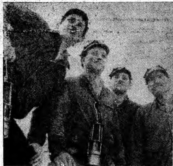
O amintire plăcută pentru brigadierul-vicepreședinte (al doilea din stînga). Cînd lucra la sectorul de producție s-a fotografiat alături de trei foști ortaci.