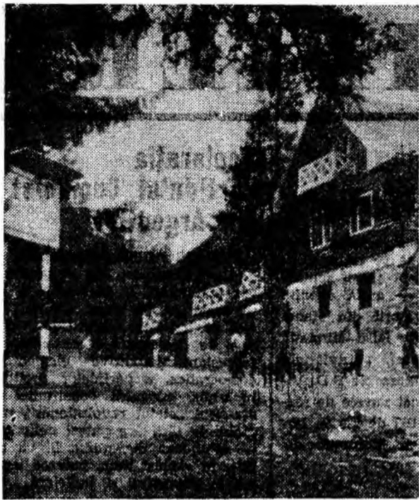
Așezată într-un cadru natural montan atrăgător și avînd un personal de deservire atent, primitor, ospitaliera cabană Cimpu lui Neag este vizitată cu plăcere de turiști în orice sezon.

Deci, atenție părinți care înfiatți copii!