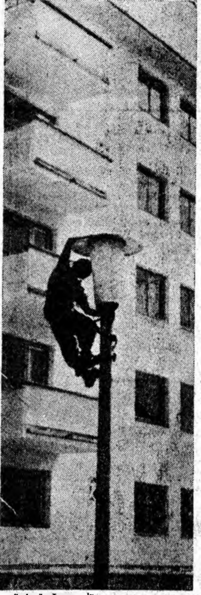
Sub balcoanele noului bloc se instalează lămpădarul cu neon.