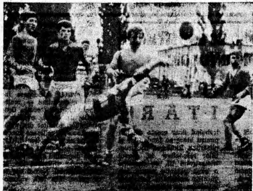
Scăpat de supravegherea adversarului, tînărul handbalist de la Liceul din Agnita sutează cu putere la poarta echipei Liceului din Sebeș.