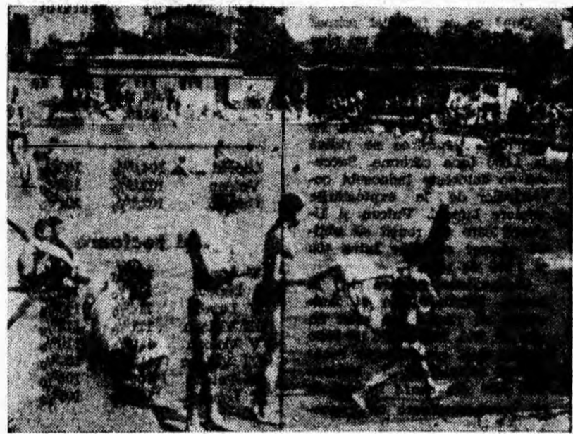
Amatorii înotului la start.

Oferind aceste condiții, ștrandul din Lupeni e tot mai mult căutat de amatorii bazinului de înot. Duminică bunăoară, ștrandul a avut peste 700 de musafiri, localnici și oaspeți sosiți din alte orașe. Printre musafiri s-a aflat și un grup de tineri de la Școala sportivă de elevi nr. 1 din București care a deschis, printr-un concurs de înot, programul duminical al ștrandului.