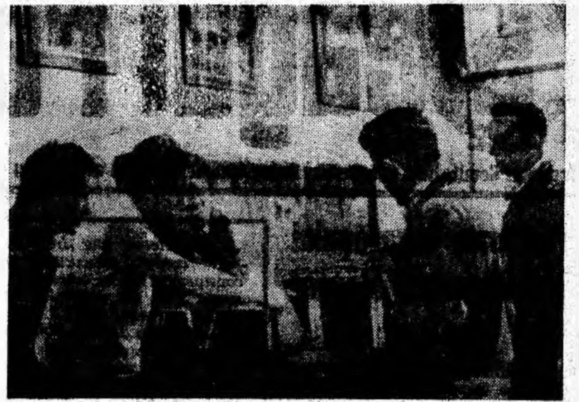
Familiarizare cu mina prin intermediul machetelor din cabinetul N.T.S.

În pagina de față ne-am propus prezentarea succintă a factorilor care au asigurat colectivului E. M. Petrila obținerea unor rezultate meritorii în domeniul protecției muncii.