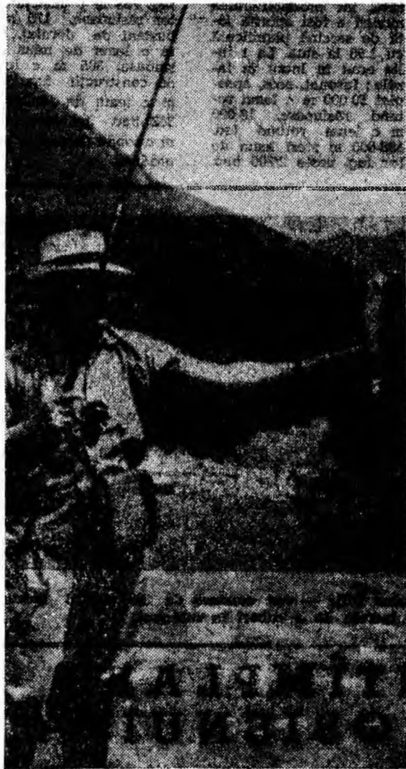
Pescuit rodnic pe Rîul Mare.