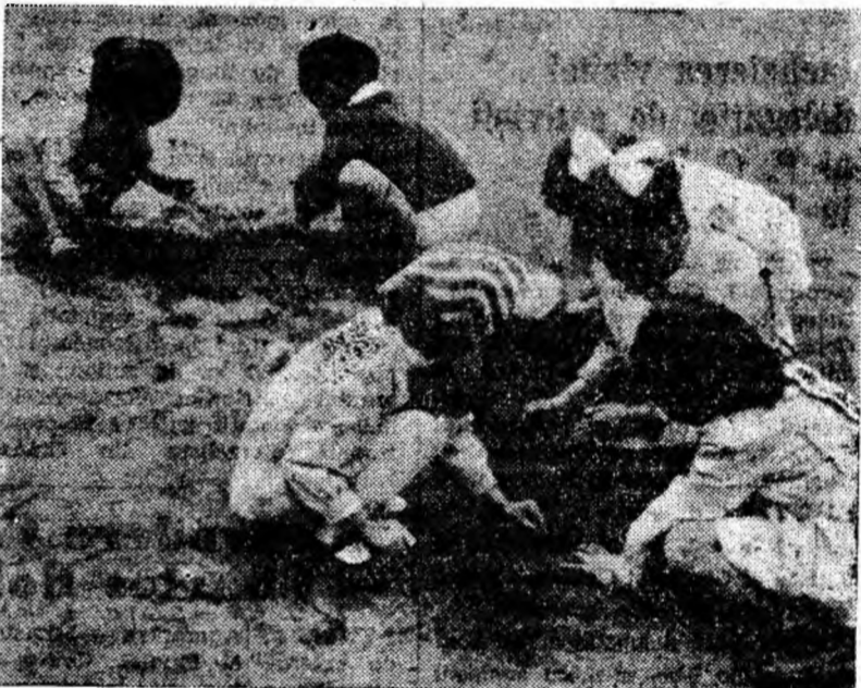
Joaca de-a... constructorii.