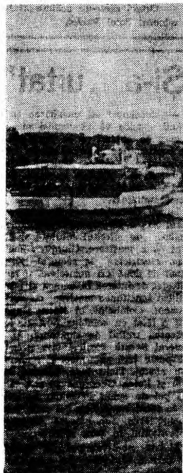
In portul Tomis.