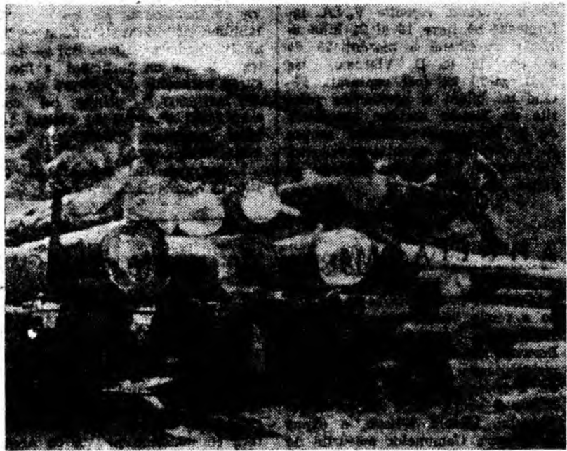
Rampa de încărcare a exploatării forestiere Sorbu, sectorul Roșia.

Din tabloul activității fabricii, reiese că printr-o muncă susținută și bine organizată colectivul acestei unități noi și moderne luptă pentru asigurarea unei bune aprovizionări a populației din Valea Jiului cu produse lactate de calitate.