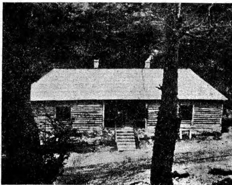
Noua cabană de la Jigoreasa asigură condiții bune de cazare muncitorilor forestieri.

Luptînd pentru dezvoltarea în continuare a succeselor obținute, în 23 de zile din semestrul II, forestierii Văii Jiului au dat 1.924 m c bușteni gater rășinoase, 4.872 m c bușteni gater fag, 236 m c bușteni derulaj, 439 m c lemn de mină rășinoase, 96 m c lemn de celuloză, 663 buc. traverse, 6.183 m steri lemn de foc, 762 m c chereștea și alte sortimente de produse lemnoase — la unele dintre ele obținîndu-se importante depășiri ale sarcinilor de plan.