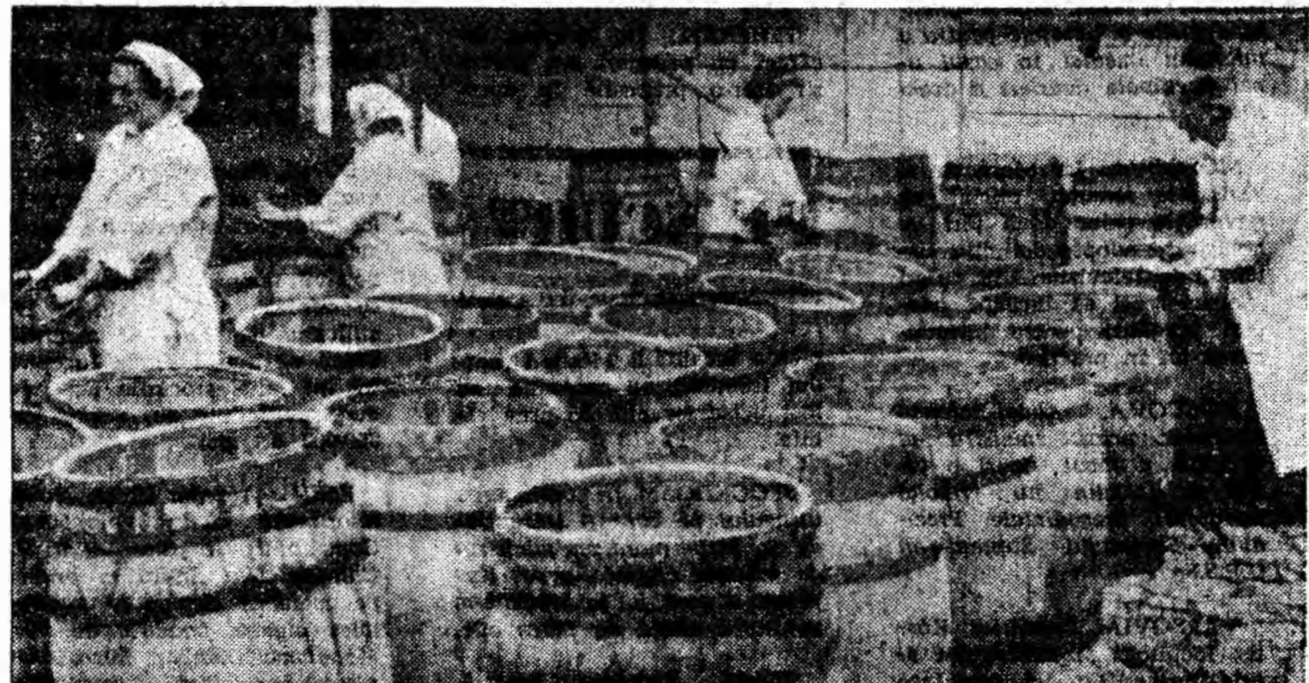
Culesul fructelor de pădure a început. La centrul de colectare de la Bărbăteni s-au primit numai în primele zile 9 000 kilograme zmeură și 5 000 kilograme atine. Recolta bogată de fructe de pădure este conservată în zeci și sute de butoaie.

Și atunci, la 15 septembrie, cînd fețe rumene, bronzate, se vor întoarce cu zîmbetul pe buze în băncile pe care le-au părăsit o bună bucată de timp, școlile să le primească sîrbătorește, așa cum le stă lor bine, așa cum e frumosul nostru obicei.