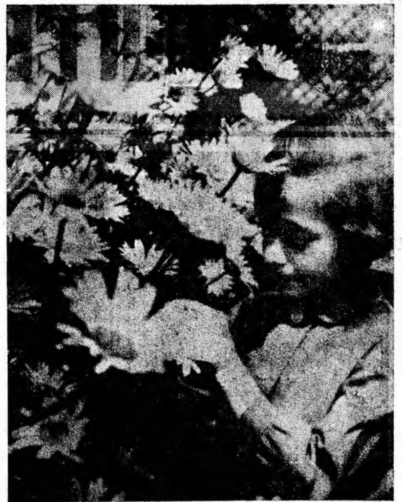
„Eu nu rup margarete. Îmi place numai să le privesc”.

lă? Nautragiu? Se mînie Neptun, își pierde răbdarea și provoacă furtună în larg? Nu. Furtuna s-a iscat într-adevăr, dar nu în larg, ci în sala cinematografului, deoarece iarăși s-a pierdut... faza. De astă dată, însă, parcă s-a pierdut de tot. Și deși agitația călătorilor se întîrește, disperarea timonierilor așigderă, iar ofurile se transformaseră într-o furtună de aplauze și illurăturiperate.