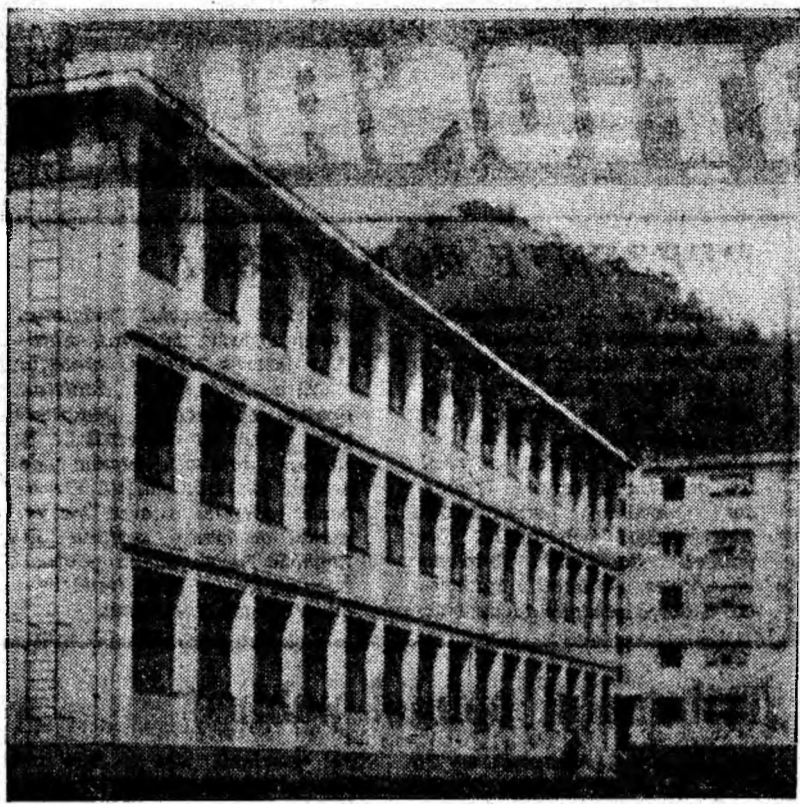
Geometrie nouă pe orizontală și verticală. Școala generală nr. 5 Petrița, dată în folosință în toamna anului trecut, își așteaptă pentru a doua oară oaspeții dragi — elevii.