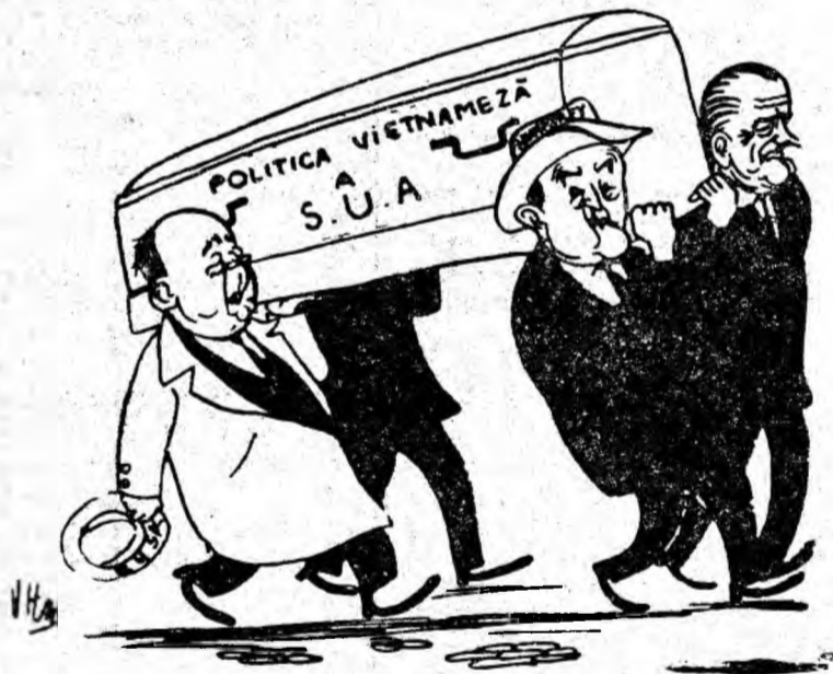
(„KAMBUJA” — PNOM PENH)

Guvernul R. P. Ungare, se spune în notă, este gata să acorde orice ajutor poporului vietnamez în lupta lui dreaptă împotriva agresiunii imperialismului american și consideră că singura modalitate de restabilire a păcii în Vietnam este încetarea agresiunii americane și îndeplinirea tuturor cererilor guvernului R. D. Vietnam și ale Frontului Național de Eliberare din Vietnamul de sud.