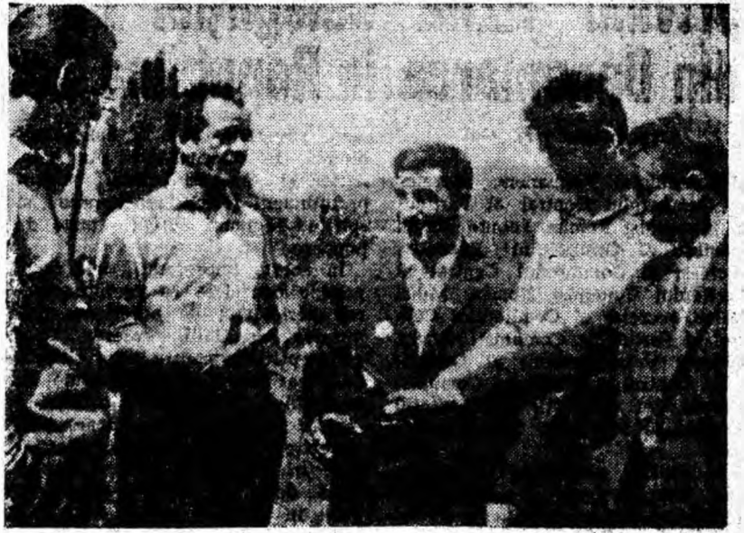
„La un pahar cu bere”

A m privit în sală la sute de mineri lupeneni, fețele lor strălucind satisfacții și bucurii. Sînt bucurii ale marilor împliniri, ale victoriilor ce le înscrie azi detașamentul minerilor în istoria poporului român, după pagini scrise cu litere de foc de către înalțași. Sînt bucurii ale realităților de mine, ce prînd tot mai mult contur, în urma marșului impetuos ce-l parcurgem spre viitor, sub același stindard luminos — al partidului comunist — marș în care detașamentul brav al minerilor își ocupă locul cu demnitatea tradițională.