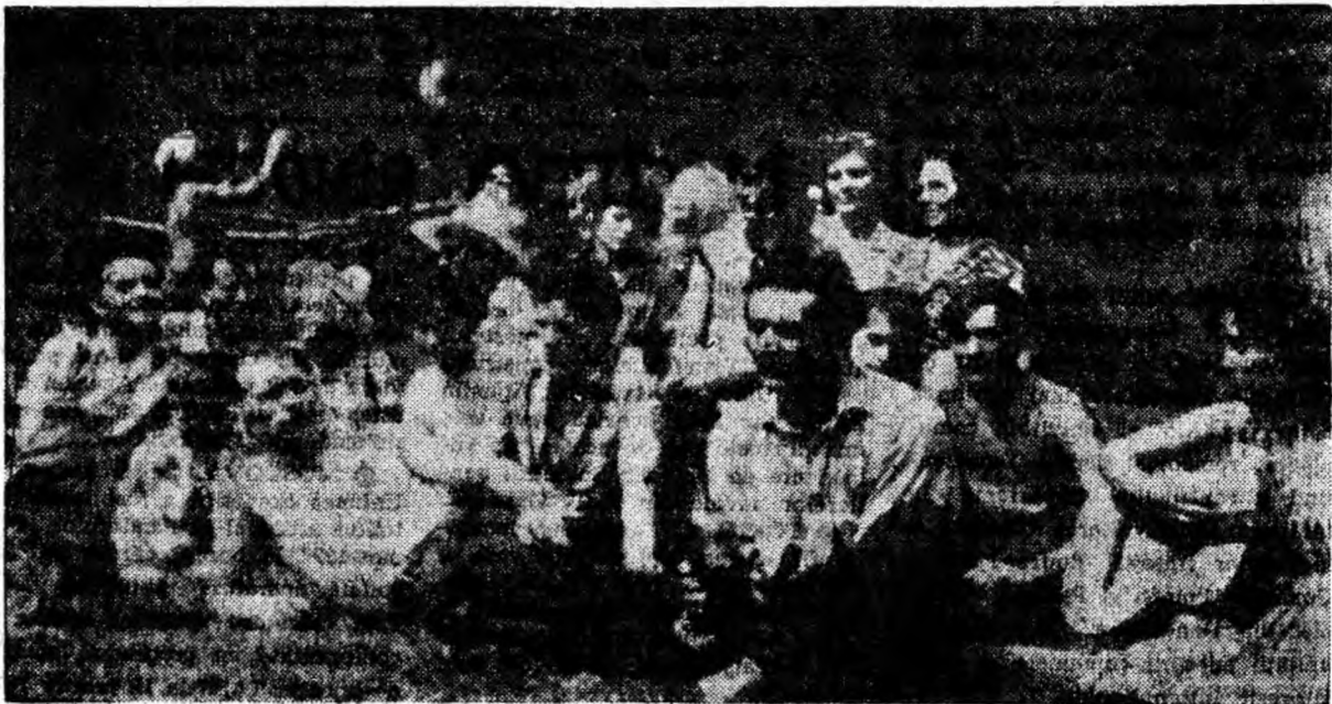
Doar cîțiva din excursioniștii care duminică au poposit la polana de lîngă Peștera Bolii.