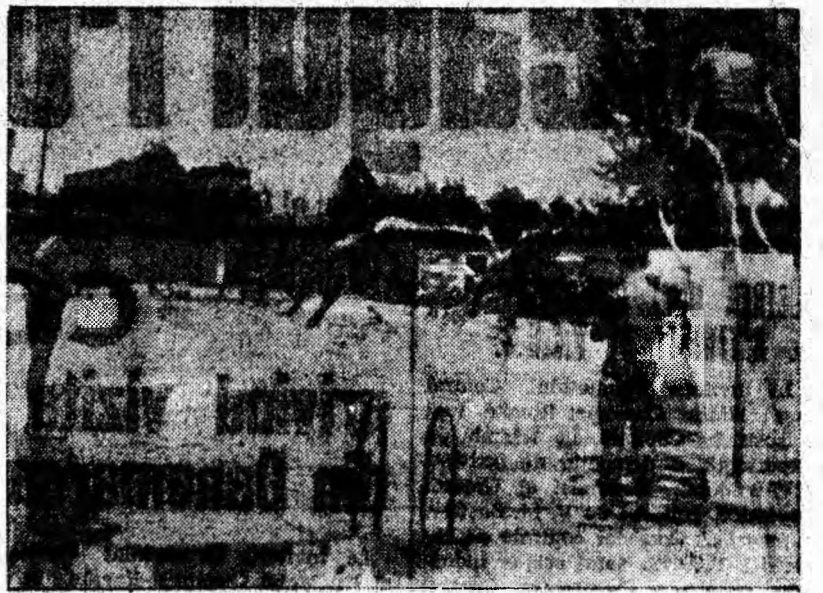
La strandul din Lupeni animația de înotători a fost duminică mai mare ca de obicei.

Iată-i pe câțiva tineri demonstrându-și măiestria prin sărituri acrobactice de la trambulină.