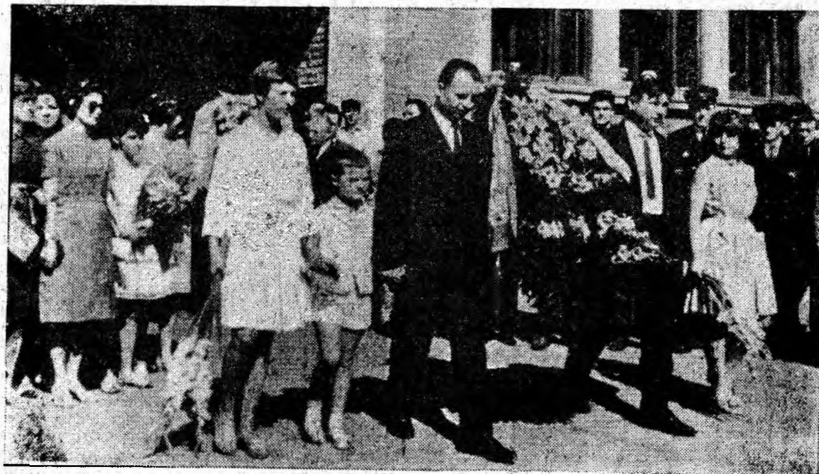
Depuneri de corôane la monumentul eroilor din curtea exploatarei.