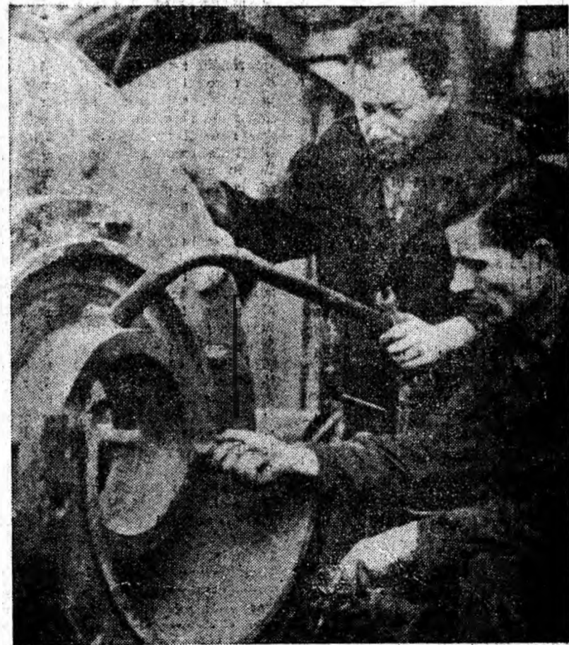
Reparații la pompele hidraulice pentru evacuarea zgurei și cenușei din focarele cazanelor.