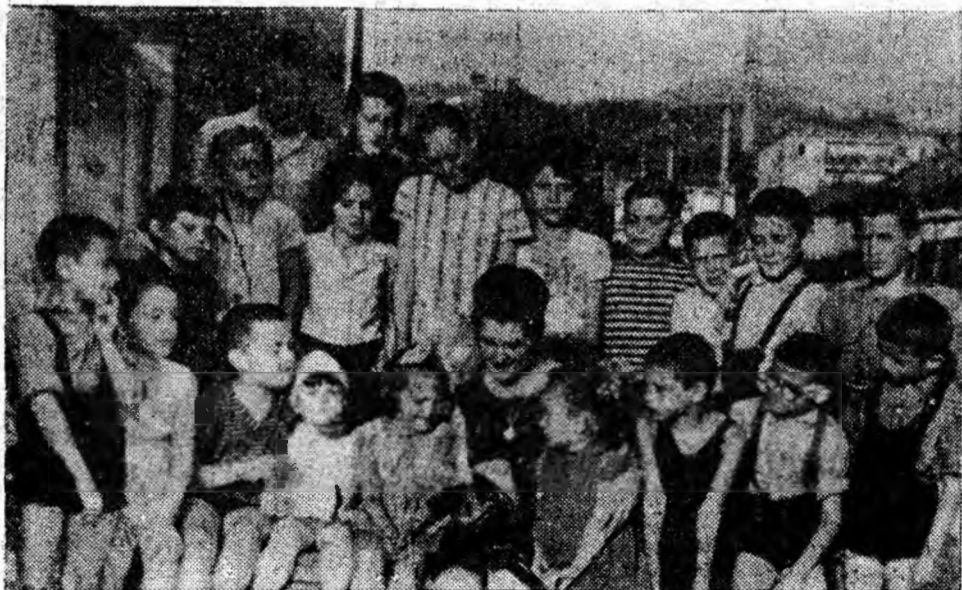
Comitetul de copii împreună cu conducătoarea lor la o oră culturală.