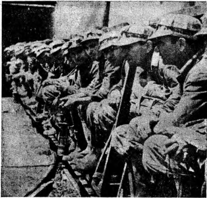
La mina Dilja, cteva momente înainte de a pleca în subteran.