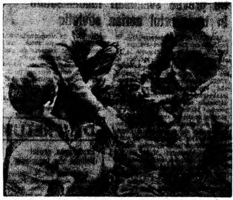
„Fiecili de giundă” au încins o aprigă partidă de '06 într-un cartier din Lupeni.

Ce fac însă marea majoritate a deputaților din circumscripțiile de care aparțin aspectele negative semnalate de noi? Au uitat ei de încrederea pe care cetățenii le-au acordat-o? Cum a muncit cu ei secțiile organizatorice ale staturilor populare? Sînt întrebări la care se așteaptă răspuns practic.