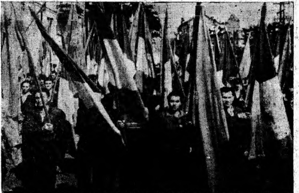
Mîndri și hotărîți trec stegarii.