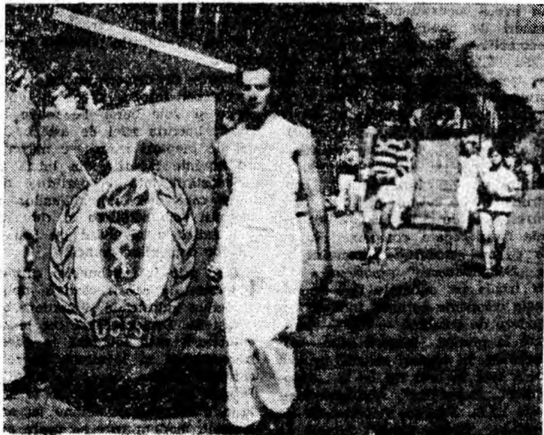
Sportivi în alb poartă emblema U.C.F.S. În urmă, brațe viguroase poartă lozinci, baloane și stegulețe, troice — rod al comportării lor meritorii în întreceri.

Trăiască și înflorească scumpa noastră patrie — Republica Socialistă Romînia!