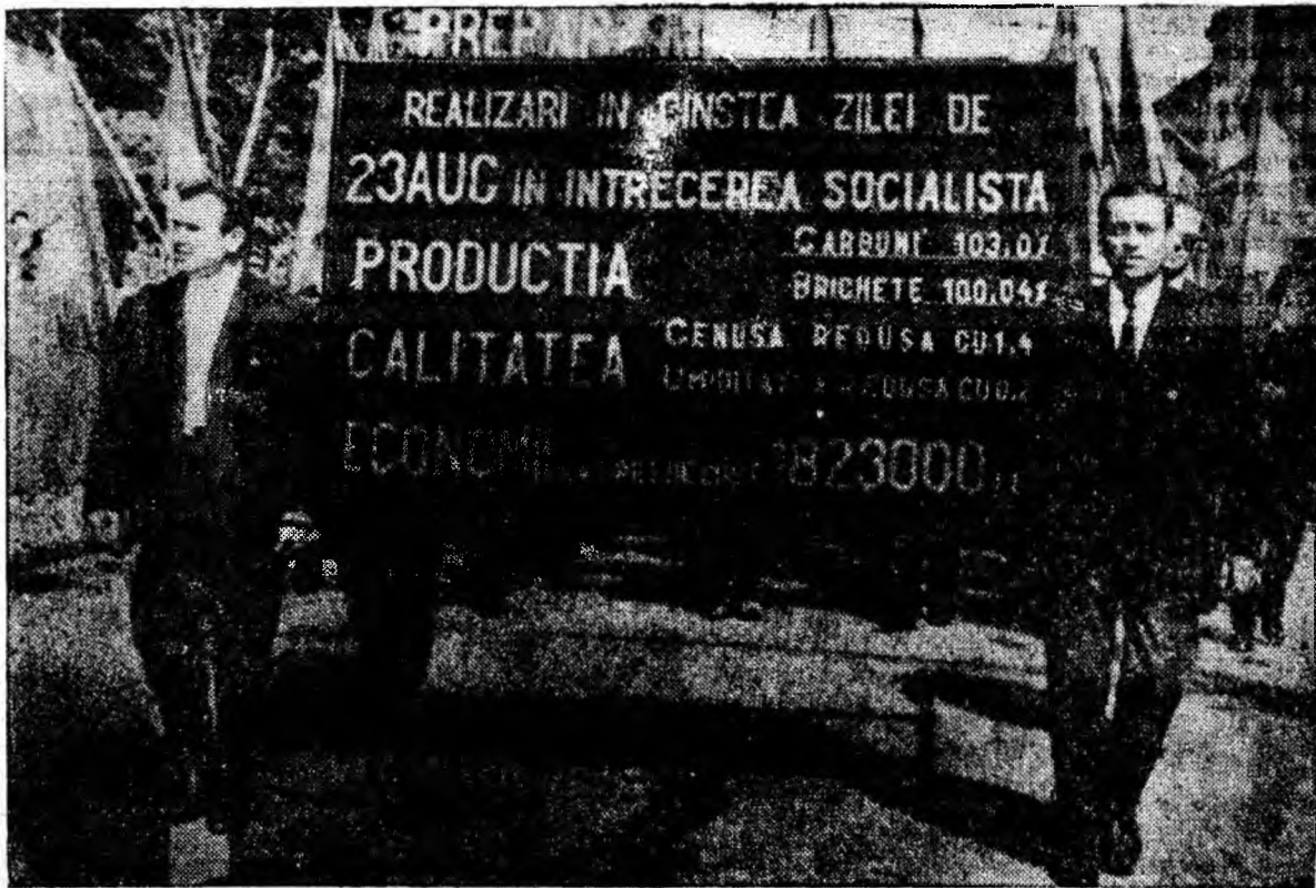
Colectivul preparației Petrila, poartă cu mîndrie panoul de onoare cu frumoasele realizări obținute în întrecerea socialistă în cinstea marelui sărbători.