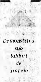
Demonstrînd sub falduri de drapele