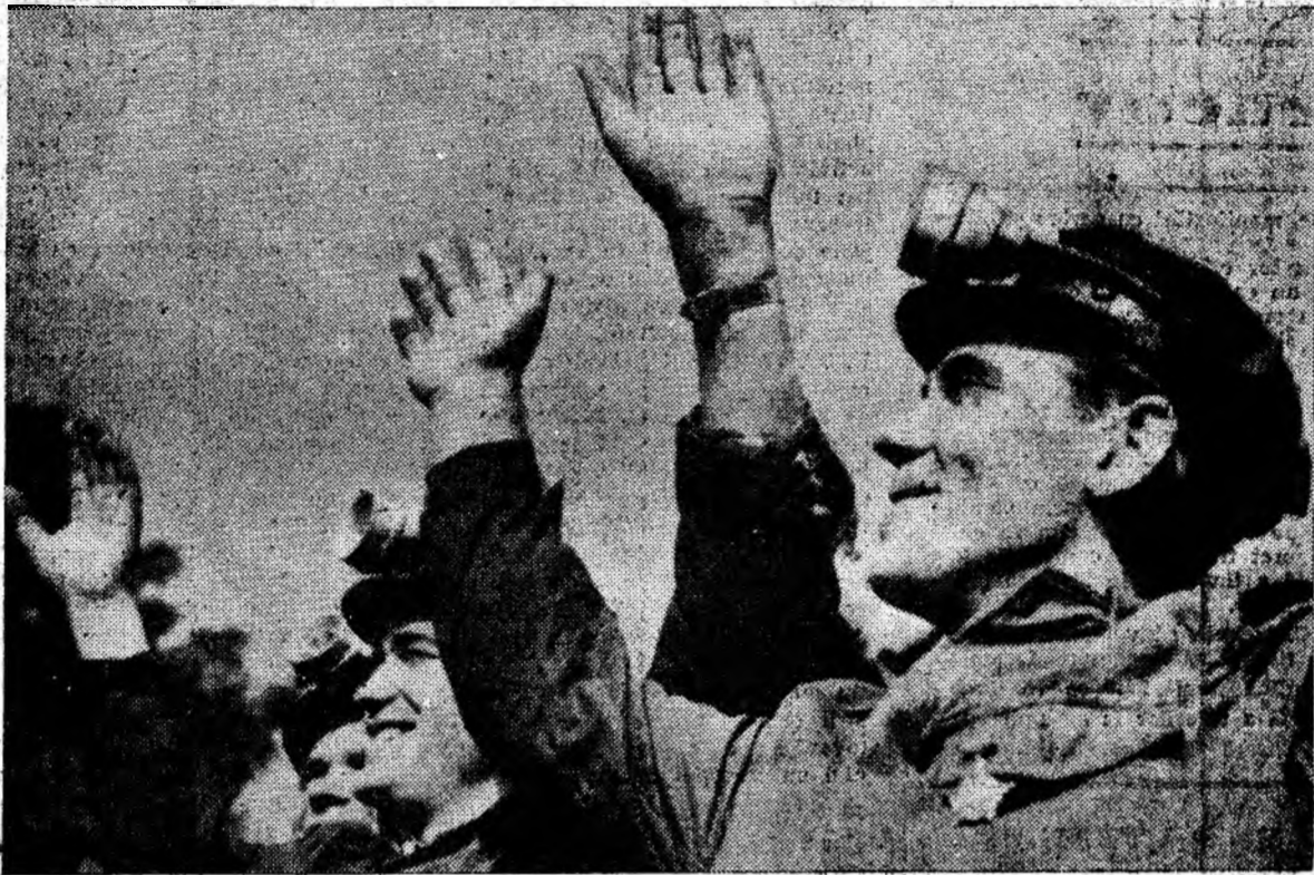
Sărbătoarea a trecut: entuziasmul, optimismul, marea încredere în viitorul luminos al patriei socialiste sînt mereu prezente.