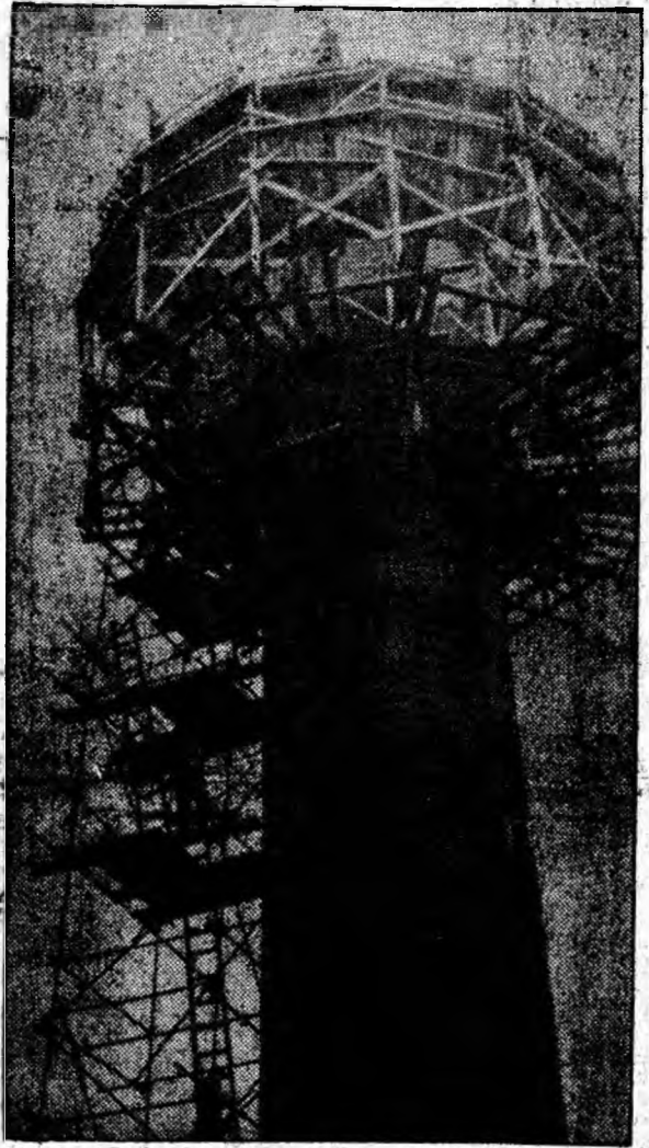
Constructorii de la T.E.M.M. înalță la mina Vulcan un nou castel de apă pentru nevoile creșterii ale exploatarea.