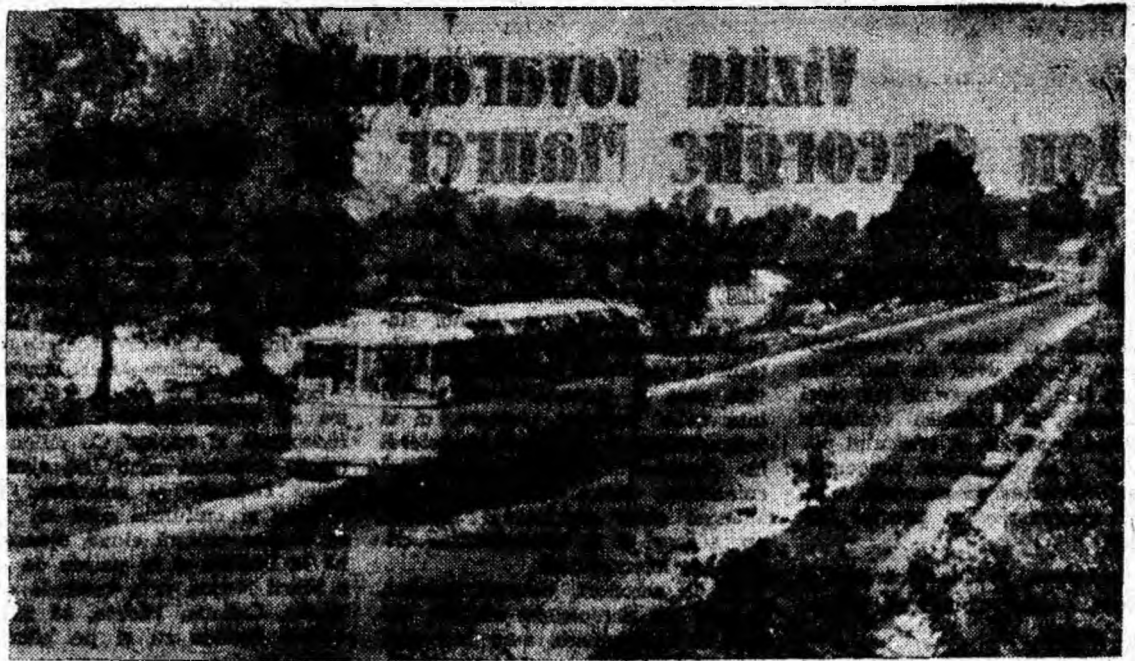
Secvență din cronica cotidiană a șoselei Livezeni — Iscroni...