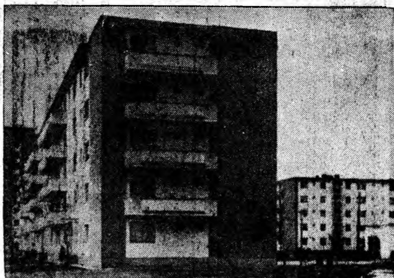
Suită de blocuri elegante în Petrila. Anul acesta, localitatea crește cu încă 664 apartamente noi.

Totodată constructorii și-au pregătit un front larg de lucru pentru perioada care urmează. La Lupeni a început gsisarea blocului A 2, iar la Vulcan a blocului D 6 și au fost pregătite fundațiile și cofrajele pentru începerea gsisării la blocurile F 4 și F 3.