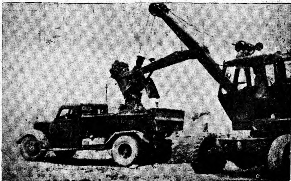
Excavatoristul Trenoiu Alexandru în plină activitate.