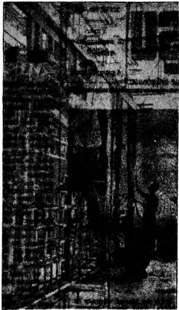
Noua clădire a Oficiului P.T.T.R. din Petroșani este pe terminete. În secția automatizării se lucrează de zor. Totul trebuie executat rapid, de calitate și estetic.