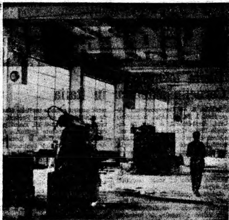
Noul atelier electro-mecanic de la E. M. Dilja a fost terminat. În hala mare și luminoasă au început să fie montate primele utilaje.