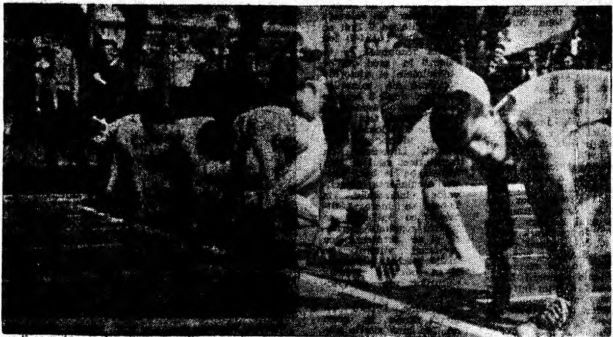
Start în cursa de 100 metri plat.