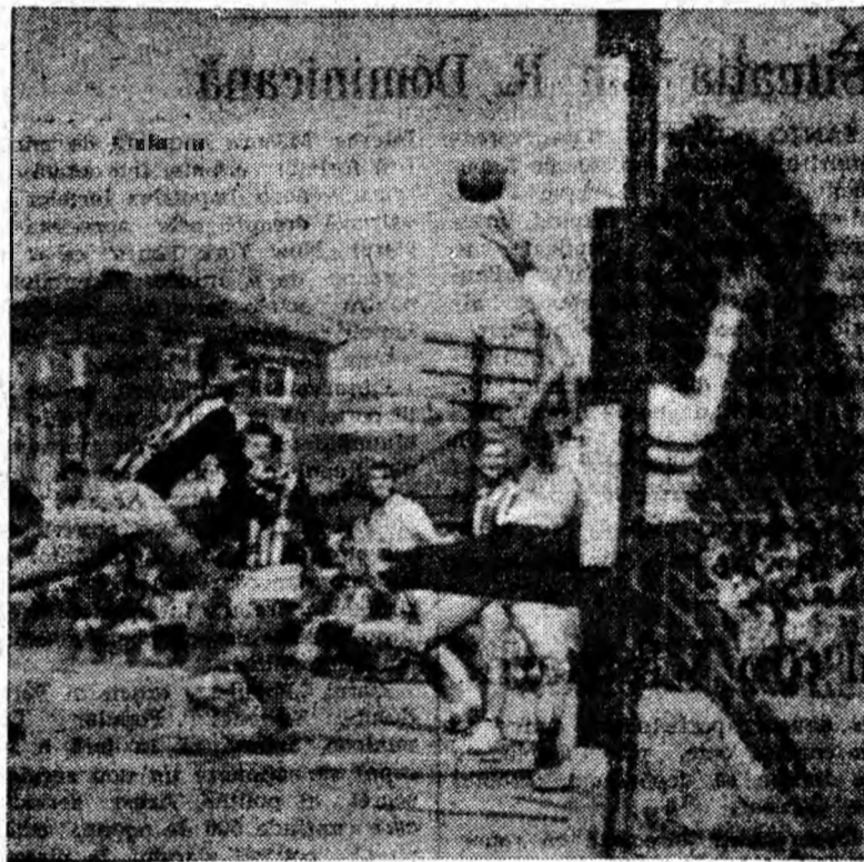
Unul dintre jucătorii oaspeți șutează puternic la poarta echipei Știința Petroșani.