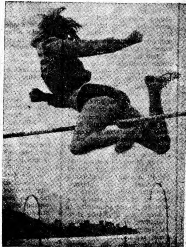
Săritură la stachetă.