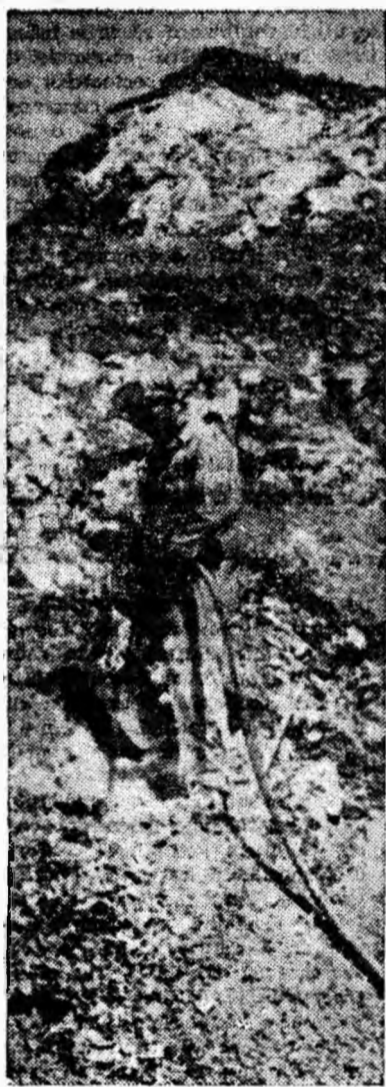
CARIERA BĂNIȚA. Se perforează găuri pentru pușcarea stîncii.