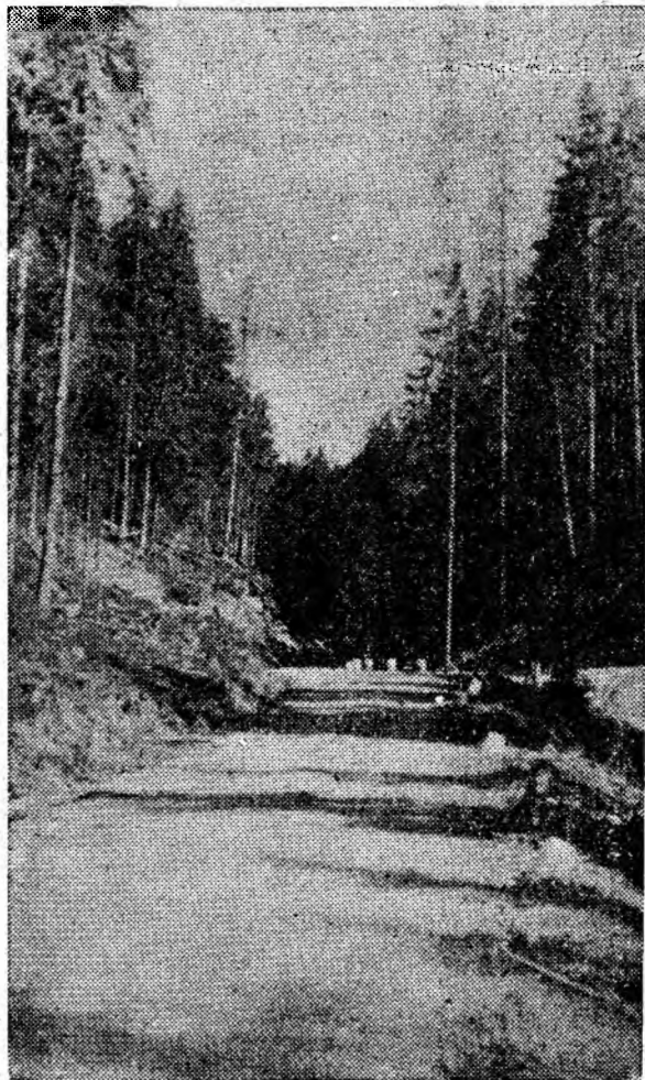
Frumosul drum forestier te invită la drumeție pentru a cunoaște splendidele priveliști montane.