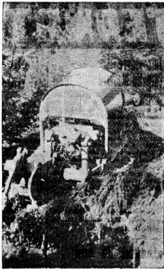
Puternicul bulldozer deschide căi noi peste munți.

Pentru turiști se deschid perspective deosebit de atrăgătoare. Incepând de anul viitor se va putea circula pe întreg traseul pornind de la Cîmpul lui Neag și pînă la Călimănești, pe Valea Otului. Ținând cont că se lucrează și pe Valea Cernei la un ascendență drum forestier, încă în acest cincișet se va crea o arteră de traversare turistică auto de la Hercuiane la Călimănești (de la Dunăre la Olt). Va fi un important traseu turistic montan — cel mai lung din țară — care va traversa Valea Cernei, Valea Jiului, Valea Lotrului, străbătând numeroși munți.