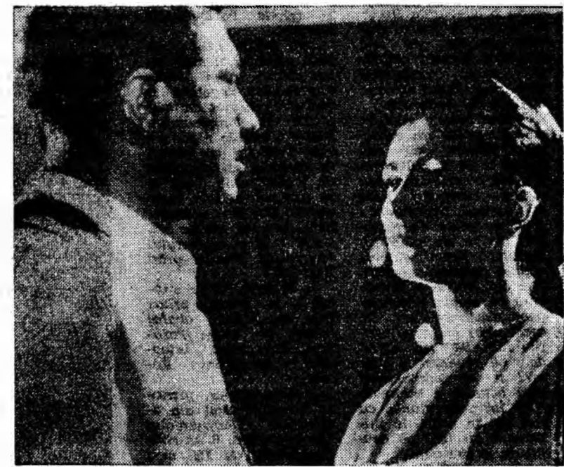
O secvență din filmul „Repulsie”.

Filmul rulează de mîine la cinematograful „Republica” din Petroșani.