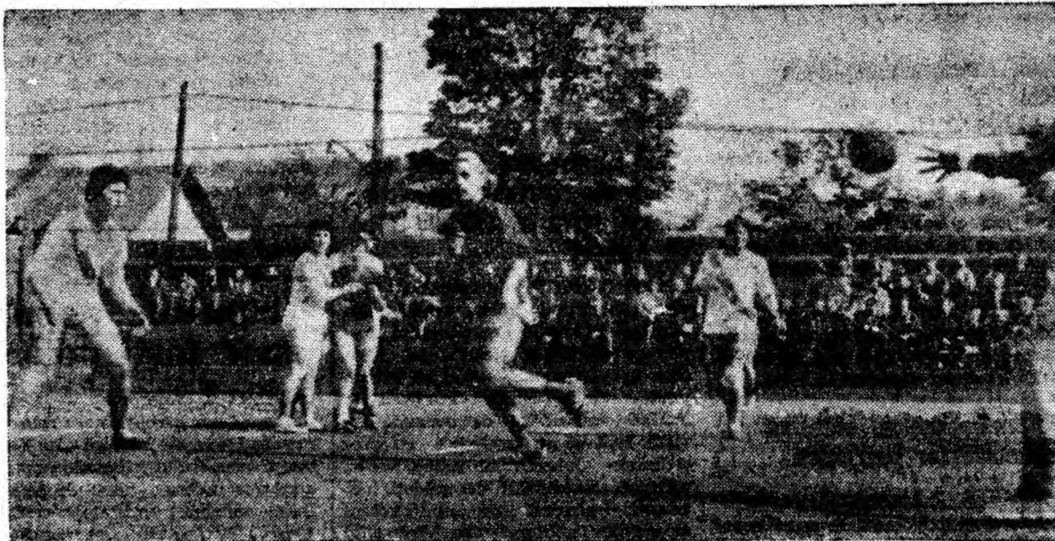
Fază din meciul de handbal feminin S.S.E. Petroşani — Constructorul Timișoara.

Arbitrul Vladimir Cojocaru din Craiova a condus cu autoritate un meci care nu i-a prea pus probleme.