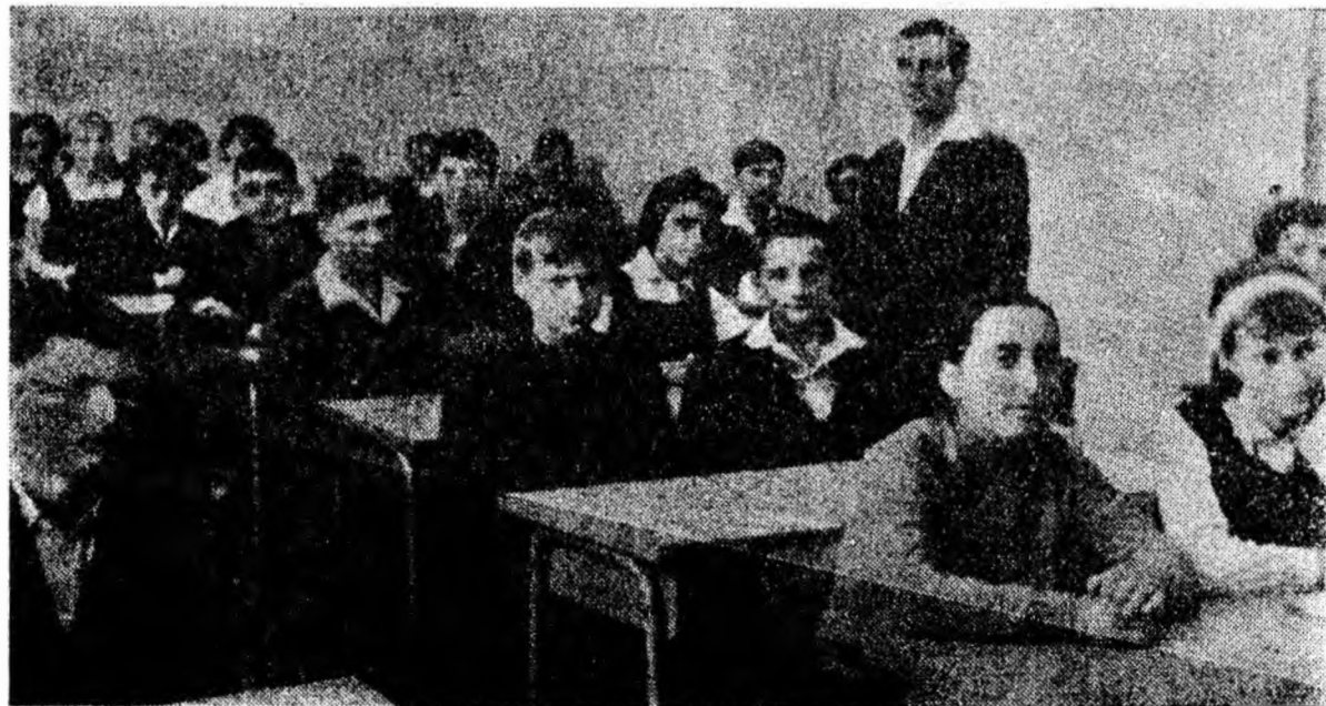
ORA DE CURS LA LICEUL INDUSTRIAL MINIER DIN PETROȘANI.

De la Muzeul de istorie a partidului comunist, a mișcării revoluționare și democratice din România