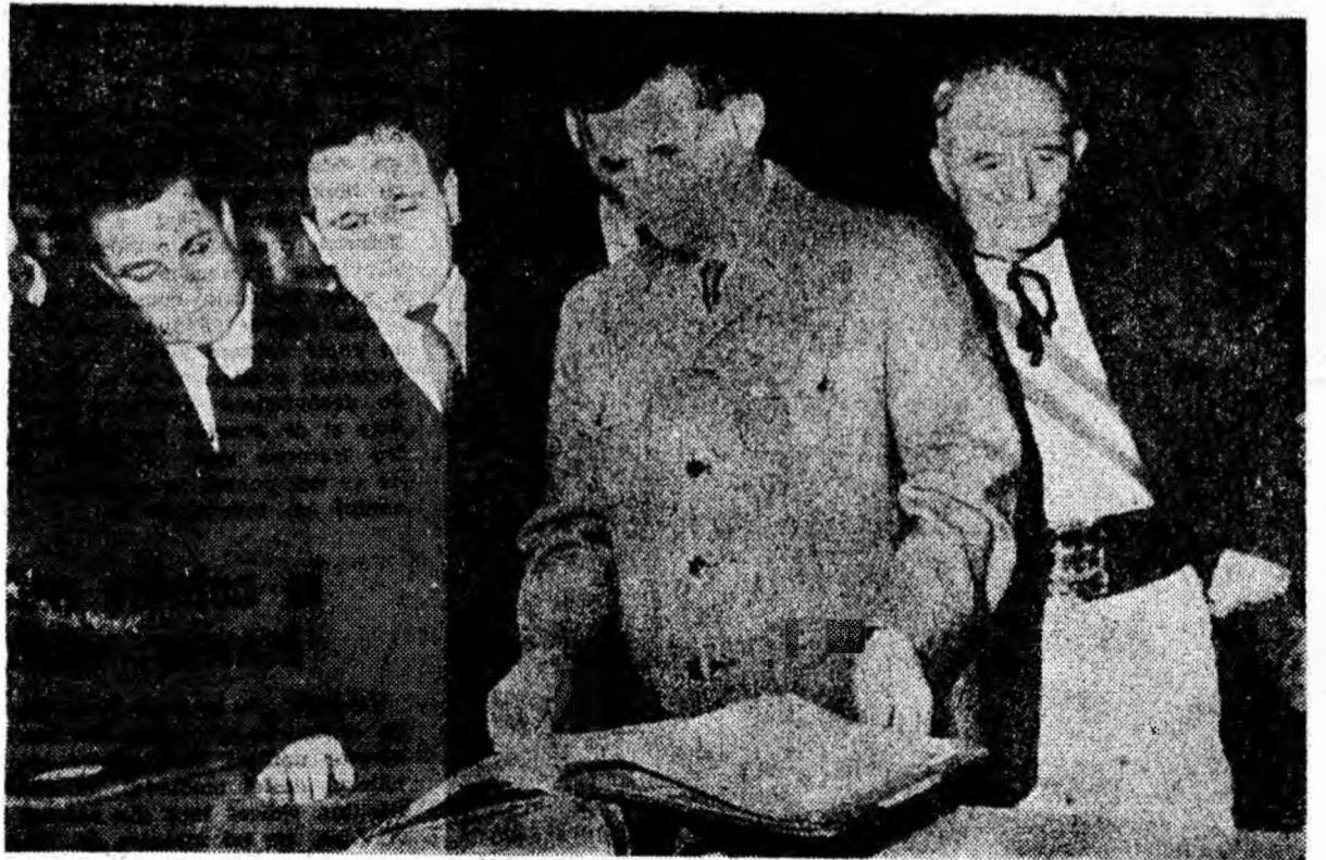
Conducătorii de partid și de stat cercetează măturările păstrate în Sala Unirii a Muzeului din Alba Iulia