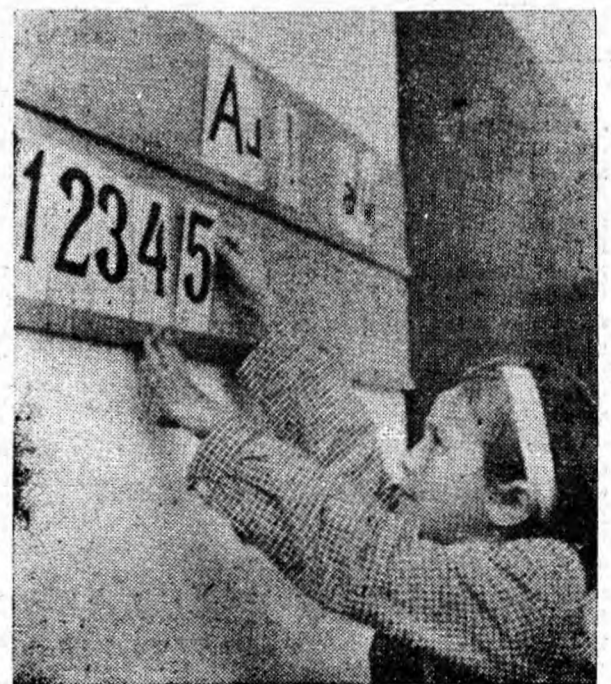
Am ajuns la cifra 5