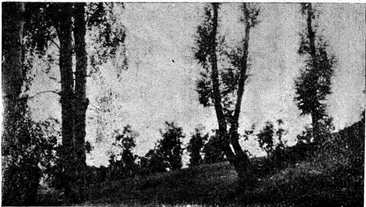
Peisaje de o frumusețe neîntrecută înconjoară localitățile noastre.

Consfătuirea va avea loc în sala mică a Casei de cultură, astăzi 21 octombrie ora 17,30.