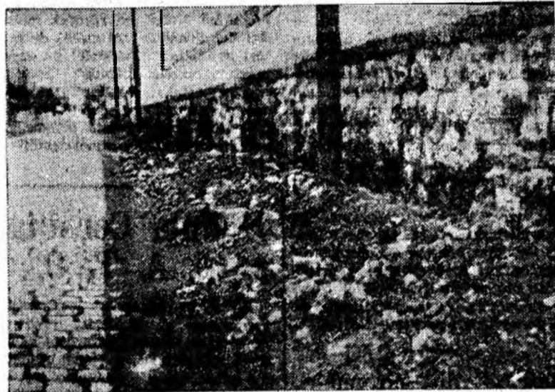
„Trotuarul” actual al străzii.

O altă cerință a pietonilor este ca tot în Petroșani pe strada Al. I. Cuza, la podul de la capătul străzii, să se amenajeze un mic podet pentru pietoni, ca cetățenii să nu fie nevoiți să aștepte trecerea mașinilor peste podul îngust pentru a trece și ei. Un mic podet în continuarea trotuarului peste canalul cu apă ar rezolva favorabil circulația pietonilor.