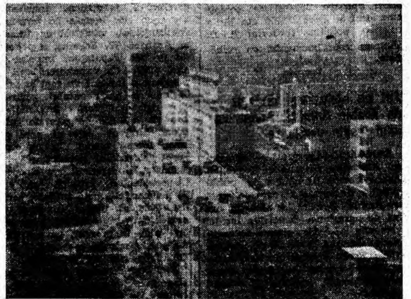
Vedere din Peirila zilelor noastre.

INFORMAȚII SUPPLEMENTARE SE DAU LA SEDIUL DIN PETROȘANI, STR. REPUBLICII NR. 60.