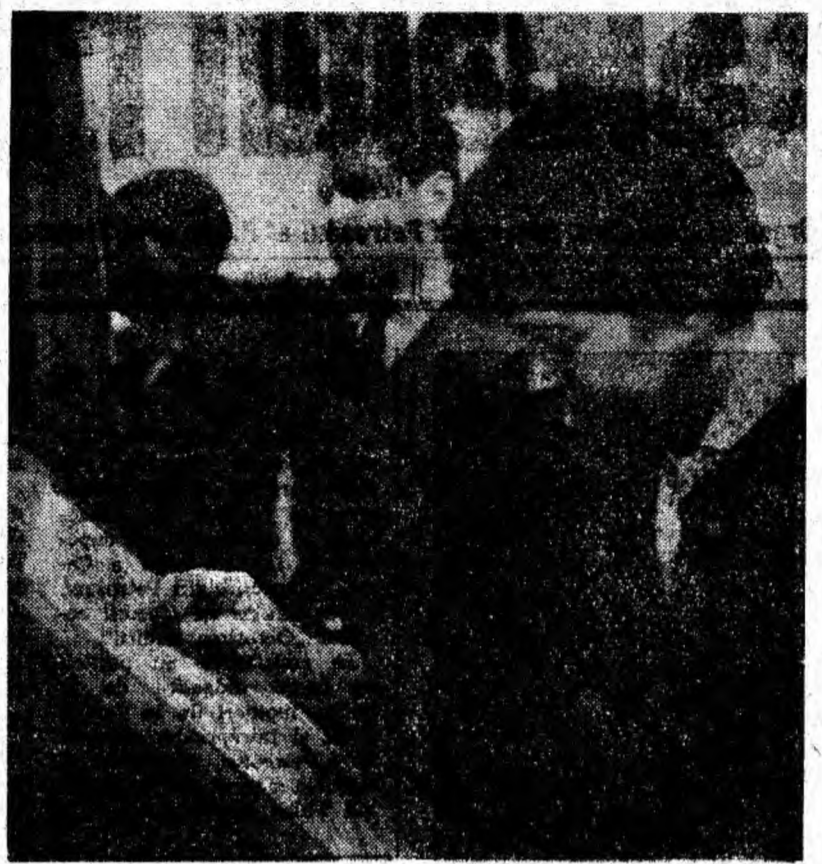
In clasa de arte plastice a Școlii populare de artă din Petroșani,

În partea a doua a spectacolului a avut loc prezentarea unei încercări mai pretentioase sub aspect artistic. Scurt metrajul intitulat „Exercițiu” a adus în fața spectatorilor cadre pline de gingașie și subtilitate, unele chiar sub un unghi înedit, din activitatea cercului de balet pentru copii, ce funcționează în