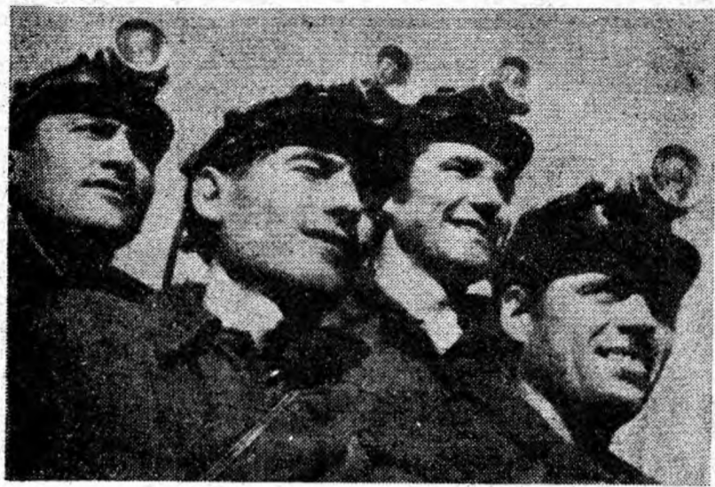
Până ieri dimineața, sectorul III al minei Uricani (a ocu- pat, la sfârșitul celor două decade, locul I în clasamentul hărniceii) avea extrase peste prevederile planului 1140 tone de cărbune.

● R. D. VIETNAM — Me- saj de protest împotriva bom- bardamentelor americane ● Subandrio condamnat la moarte ● Problema rhodesiană în atenția conferinței O.U.A. ● Ce s-a întâmplat în Laos ?