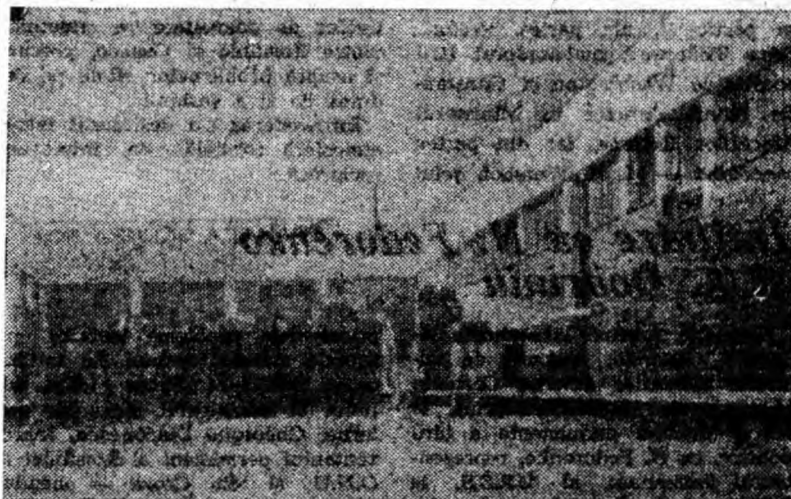
In dosul complexului comercial, din cartierul Livezeni, stau, bătute de ploaie și vînt, aceste lăzi goale. Așteaptă, cam de multîșor, să fie ridicate de către I.R.V.A. ...

Nu trebuie neglijată nici aranjarea vitrinelor, practicarea unei reclame comerciale corespunzătoare, organizarea consfătuirilor cu cumpărătorii, acestea contribuind la popularizarea mărfurilor și formarea gustului consumatorilor. De asemenea nu trebuie pierdută din vedere aranjarea interioară a magazinelor și raioanelor, modul de expunere a mărfurilor în rafturi.