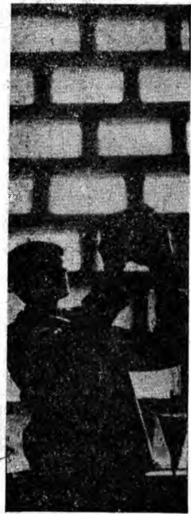
U.R.U.M.P. : CONTURURI INDUSTRIALE

Răspuns : Prin continuitate în muncă, în sensul legii, se înțelege timpul cît angajații, în ultima parte a activității, au prestat muncă în aceeași unitate. Salariatul care și-a schimbat locul de muncă de la o unitate la alta, chiar dacă aceste unități depind de același minister, beneficiază de majorarea pensiei numai dacă trecerea de la un loc de muncă la altul s-a făcut prin transfer în interesul serviciului.