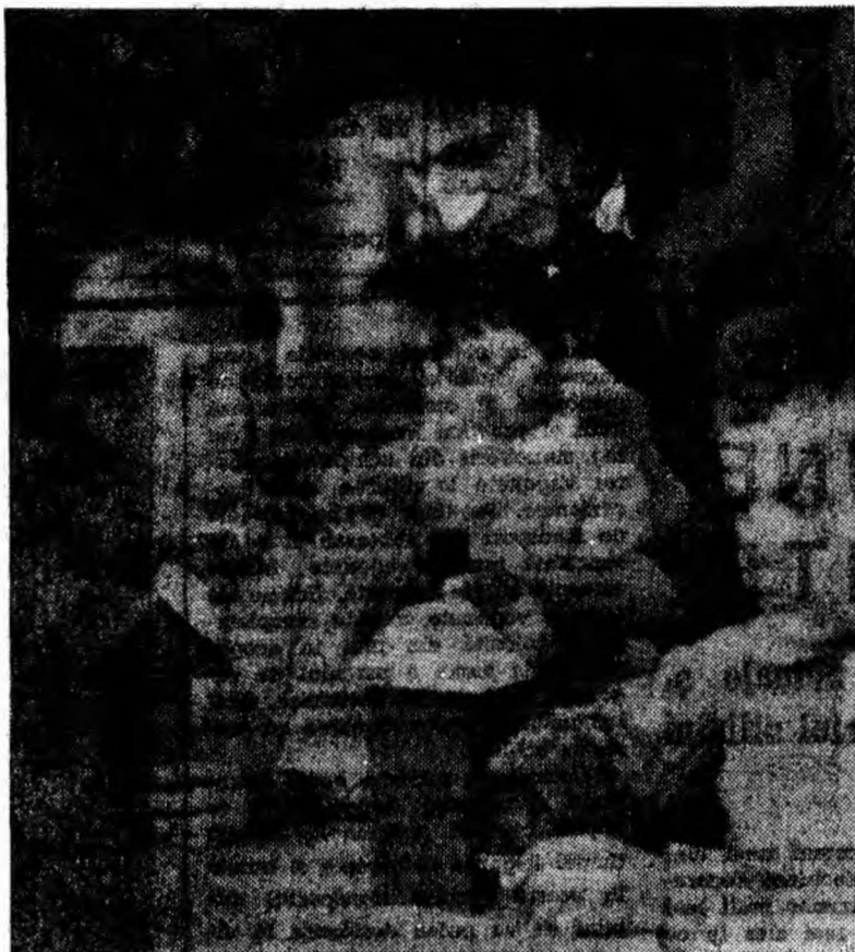
Joaca de-a constructorii...

Gei doi membri ai unei familii — soțul și soția — trăiesc o vreme în atmosfera unor preocupări statornice. Apoi universul familial, cu toate elementele sale, începe să se agite. În casă apar obiecte noi — pătuțul, suzeta, căruciorul, jucăriile. Atmosfera de încordată așteptare se extinde din mediul familial la vecini, la rudeni. Și apoi se întâmplă ceea ce toată lumea așteaptă: sosește