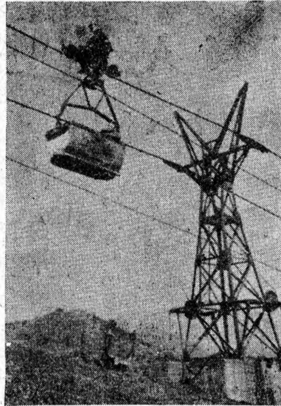
Funicularul Aninoasa — Petri-la transportă zi și noapte spre preparație cărbunelui extras din adincuri de minierii aninoseni. Asigurarea funcționării fără deranjamente a acestei lungi căi de transport reclamă din partea personalului de deservire și întreținere o muncă exigentă, pătrunsă de răspundere. După cum se vede din fotografie, această cerință este îndeplinită: echipa de control e la datorie, pe traseul funicularului.