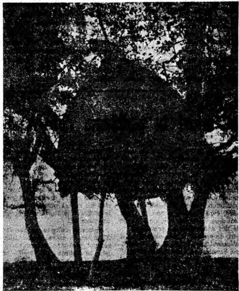
„Cluperca” dintre ramuri...

Plenara a ascultat informările prezentate de către comandanții unităților de pionieri nr. 1 și nr. 2 din Petroșani și a unității Liceului din Petrila. A fost supus dezbaterii plenarei proiectul planului de activitate al Consiliului pe următoarea perioadă pînă la vacanța de iarnă. S-a trecut de asemenea, la constituirea comisiilor pe probleme.