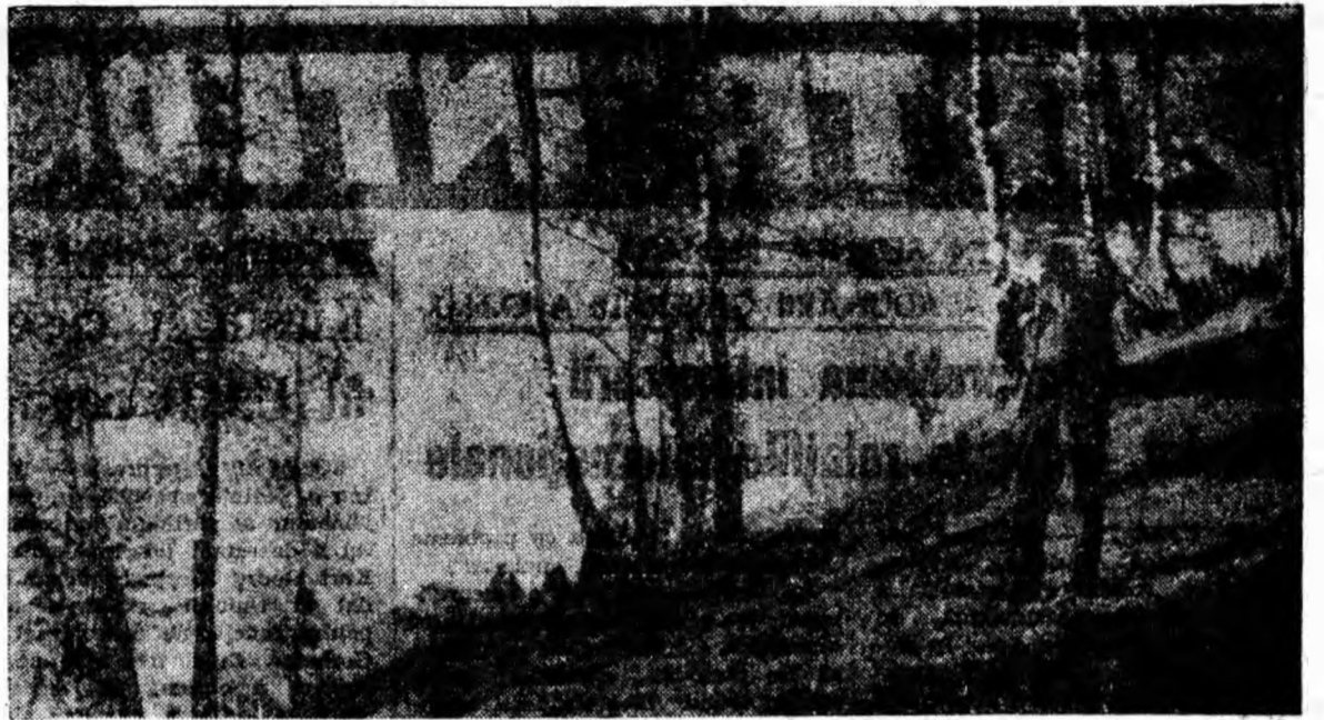
Mestecenii desfrunziți confirmă că e toamnă. Doi fotografi amatori au ținut să-i immortalizeze pe peliculă. Unul s-a dovedit mai expeditiv prinzînd în obiectiv și pe tovarășul său de drumetie.

Atrăgînd atenția asupra acestor citorva lipsuri, tovarășul Lungu Ioan și-a exprimat încrederea că forța și opinia comuniștilor din institut își va spune cuvîntul, va acționa cu promptitudine pentru înlăturarea lor, și pentru îmbunătățirea muncii instructiv-educative în întreaga ei complexitate.