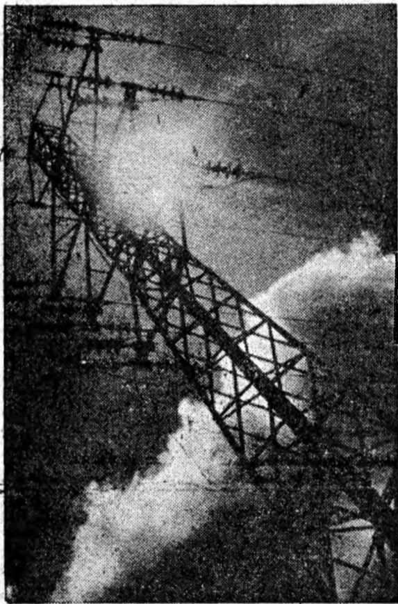
Energii... la cote înalte.