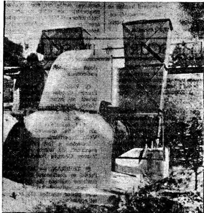
Mina Dilja este înzestrată cu instalații moderne de mare capacitate care asigură în subteran condiții optime de muncă și siguranță. Fotografia înfățișează stația de ventilatoare de la suprafață cu o capacitate de 2 500 mc/minut, dată anul acesta în funcțiune.

Dar pasiunea pentru sport încă-i puternică la tovarășul