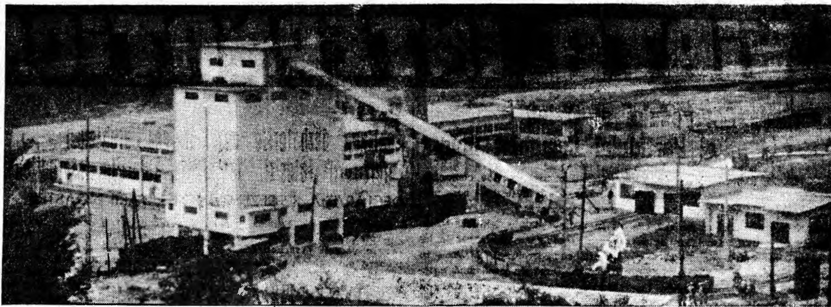
Panorama incintei minei Petrosani