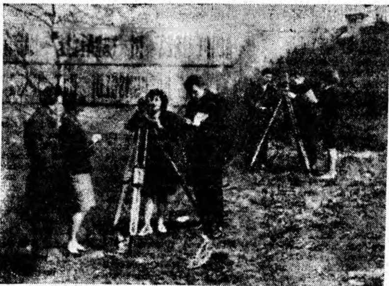
Studenți din anul V topografie la o oră de practică pe teren