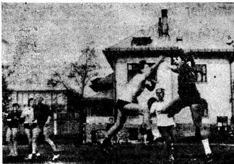
Aspect din timpul unui meci susținut de echipa de handbal S.S.E. Petroșani pe teren propriu.