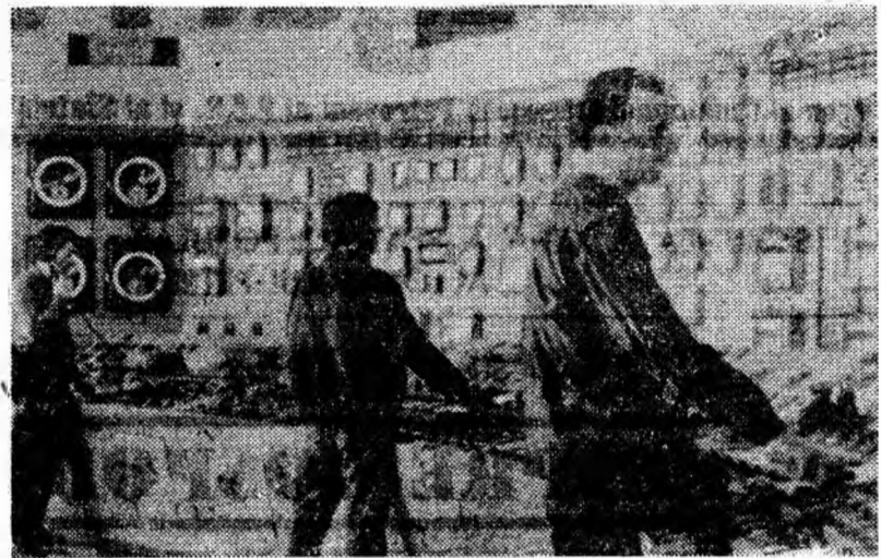
Termocentrala Paroșeni, camera de comandă termică a grupului IV

Din cele relatate, realizarea planului de producție pe anul curent de către toate întreprinderile din Valea Jiului și în special de către cele care au rămîneri, ridică necesitatea ca: