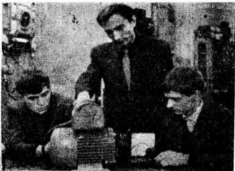
Laboratorul electric al Grupului școlar minier Petroșani. Elevi la o oră practică făcînd cunoștință cu motorul de curent alternativ.