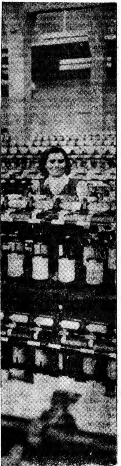
Interior de la „Viscoza” Lupeni.