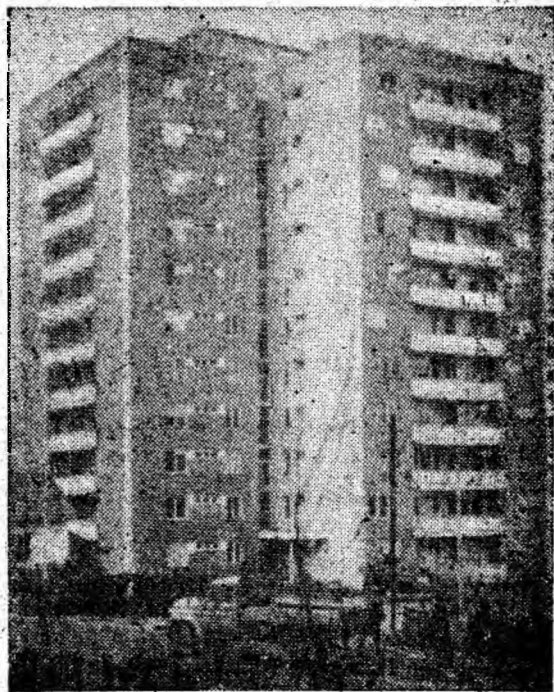
O salbă de patru asemenea minere blocuri înfrumusețează Lupeniul

Prin reducerea cheltuielilor de producție, muncitorii din Bănița au obținut economii suplimentare la prețul de cost de peste 1 100 000 lei.