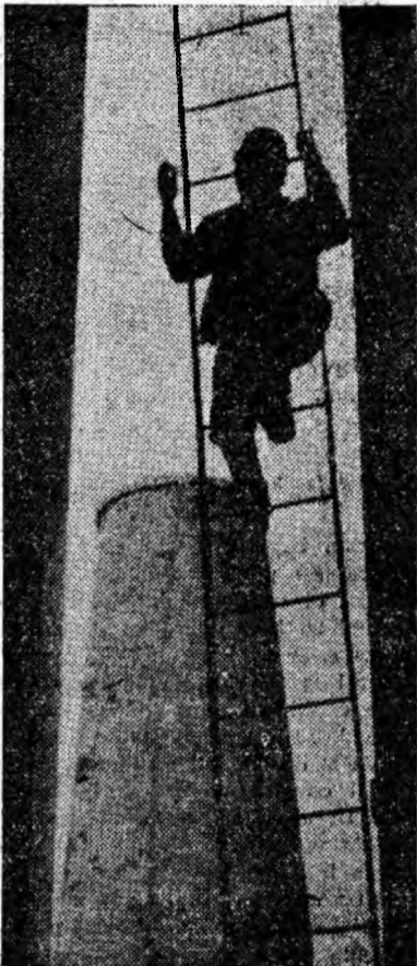
În drum spre înălțimile create de om

tiții au rămas în urmă cu 1079 m l. Deci, în loc să scadă, minusul a crescut. Sectoarele care au contribuit la acest minus sînt cele de la Dilja, Aninoasa, Paroșeni, Ūricani. De altfel, cu excepția minelor Lupeni și Petrila, nici o exploatare nu și-a realizat planul pe prima decadă. E o situație care reclamă măsuri eficiente pentru redresarea activității de investiții. Mai ales, că la unele exploatari, această cerință se impune cu imperiozitate. Este vorba de asigurarea cîmpurilor, de cărbune ale anului viitor!