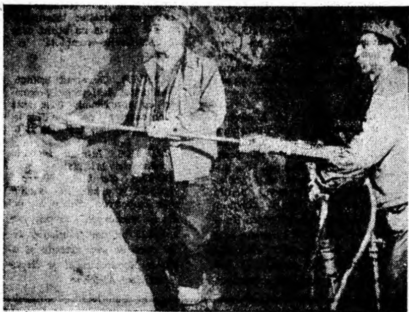
Perforajul umed, iată o metodă eficientă în prevenirea silicozei.

Îmbunătățindu-ne în permanentă activitatea în domeniul protecției muncii, al respectării N.T.S. să obținem succese în îndeplinirea sarcinilor de plan, a angajamentelor de întrecere în condiții depline de siguranță a muncii.