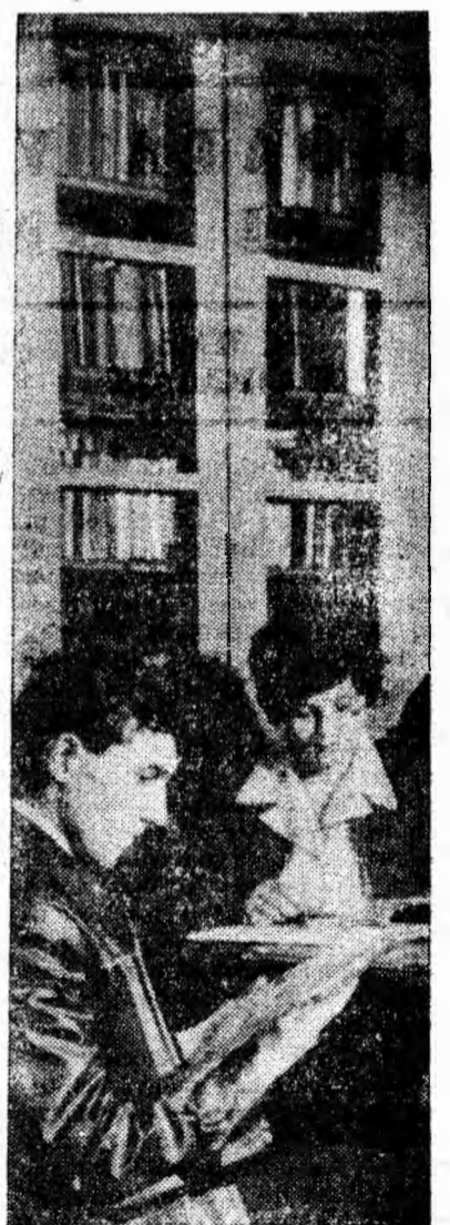
Instantaneu de la biblioteca clubului muncitoresc din Petrila